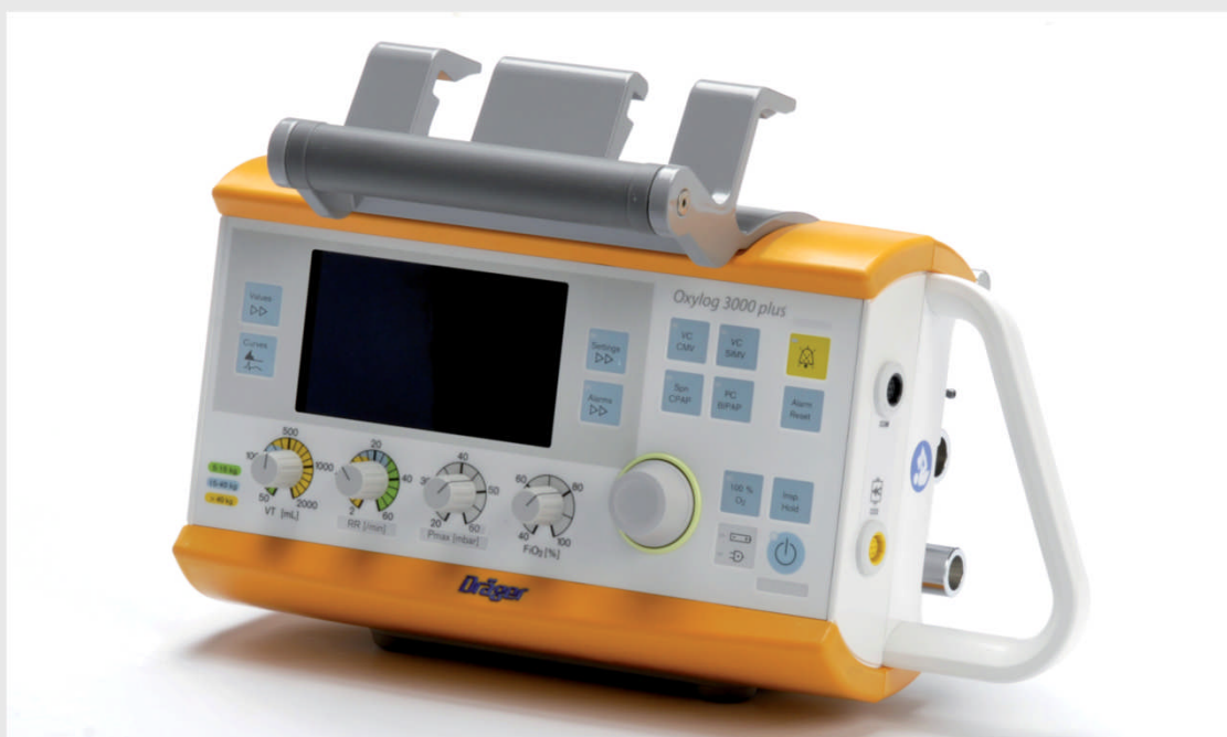
OXYLOG 3000 Plus